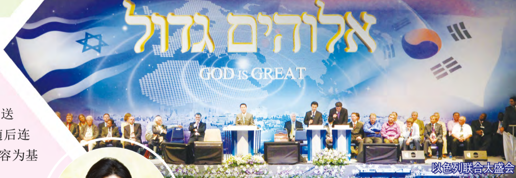
以色列联合大盛会