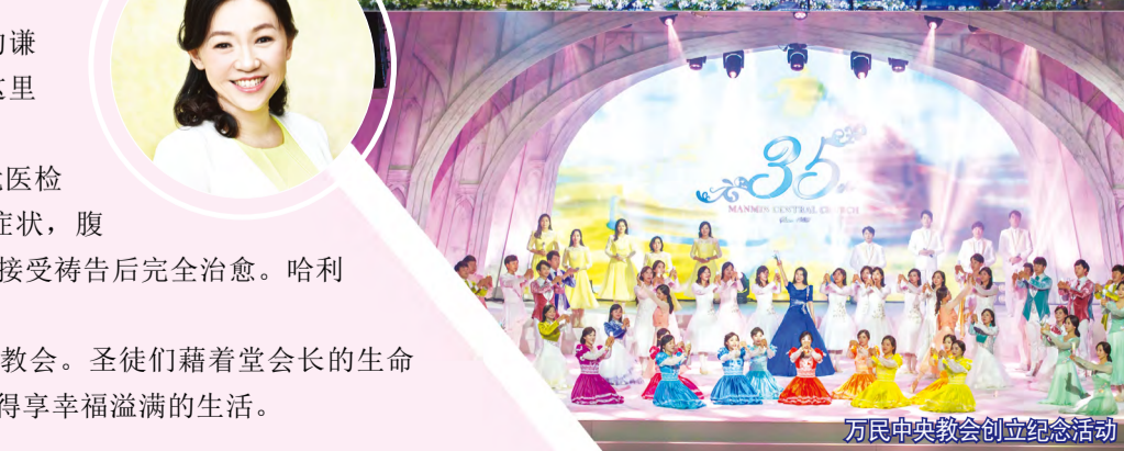
万民中央教会创立纪念活动