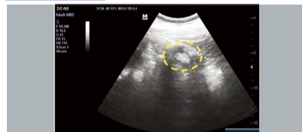
▲ 接受祷告前：表现疑似阑尾炎，周围显见发炎迹象。