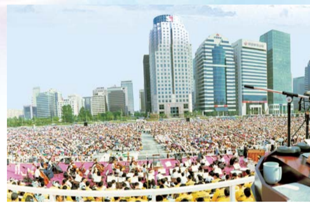
1995汝矣岛广场光复五十周年纪

然而，神要的不只是这种“量”的成长，祂愿意圣徒一个个都成为“麦子”，结出饱满的籽粒。为此，神在90年代末，允准了三次大试炼，分出“麦子”和“糠秕”、从“庄稼”中薅出“稗子”。经历三次大试炼，我得到超前的大权能。