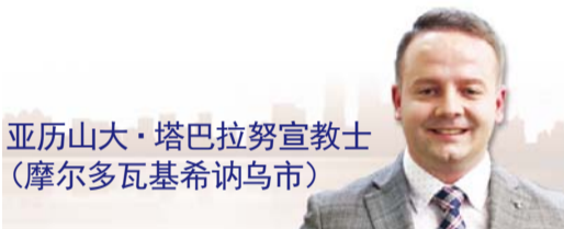
亚历山大·塔巴拉努宣教士 (摩尔多瓦基希讷乌市)

2009年10月, 在俄语电视台TBN俄罗斯上聆听的李载禄牧师的证道“地狱”, 令我大受震撼和感动。随后的日子里, 我透过电视以及万民中央教会网站、Youtube、胜利网等, 对李载禄牧师的讲道信息, 边听边做摘要整理。在这过程中我戒掉烟酒, 得到重生新造。