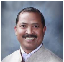
印度中央政府国会议员 文森特·帕拉议员

真心祝贺万民中央教会创立三十八周年。感谢李载禄牧师将全世界众多灵魂领入得救之路、神的国。