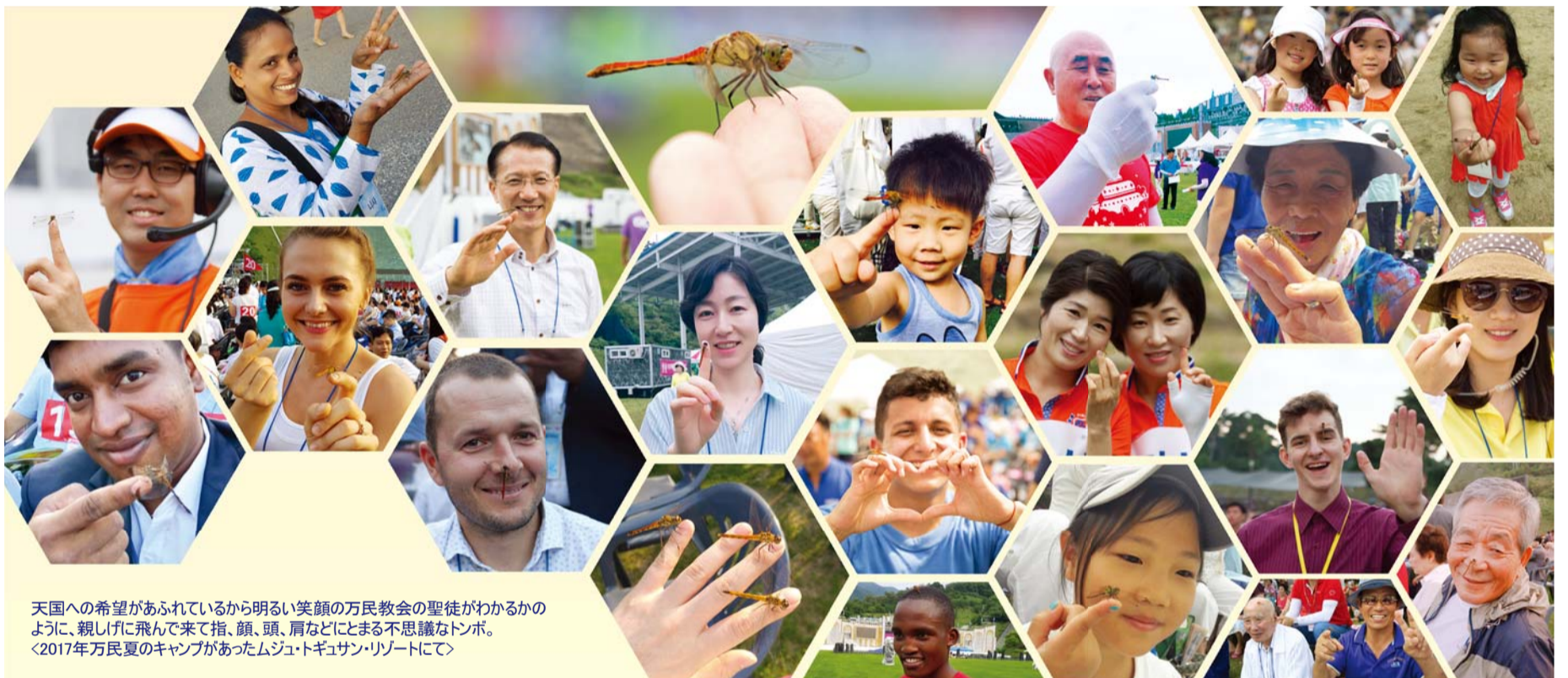
天国への希望があふれているから明るい笑顔の万民教会の聖徒がわかるかのように、親しげに飛んで来て指、顔、頭、肩などにとまる不思議なトンボ。 〈2017年万民夏のキャンプがあったムジトギサン・リゾートにて〉