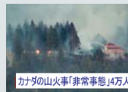
カナダの山火事「非常事態」4万人