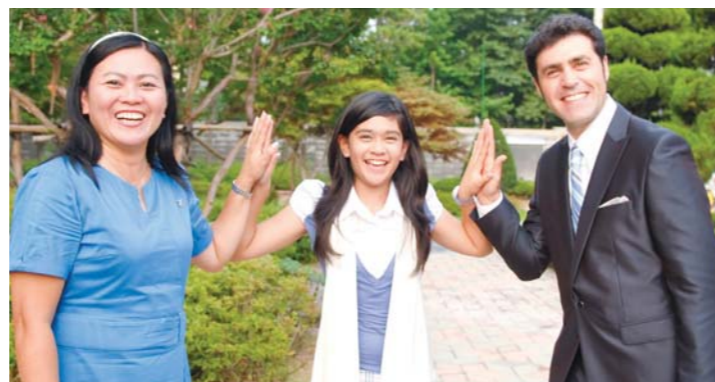
8月、マンミン夏のキャンプに参加するために韓国を訪問したダニエル・ローゼン牧師

www.danielrozen.org/en www.jfils.org www.wednisrael.org