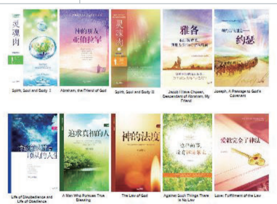
이재록 목사 저서 10종(중국어 간체) 온라인 전시 ▶

지난 1월 26일부터 31일까지 온라인으로 개최된 '2021 대만 타이베이 국제 도서전'에 기독교 출판사 우림북(대표 김진홍 장로)이 참가해 당회장 이재록 목사의 저서를 소개했다.