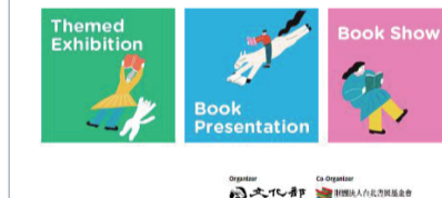
▲ '2021 대만 타이베이 국제 도서전' 웹사이트