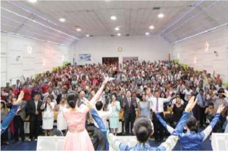
فترة التسبيح في مؤتمر الرعاية الذي عقد في كنيسة مائمين بيرو