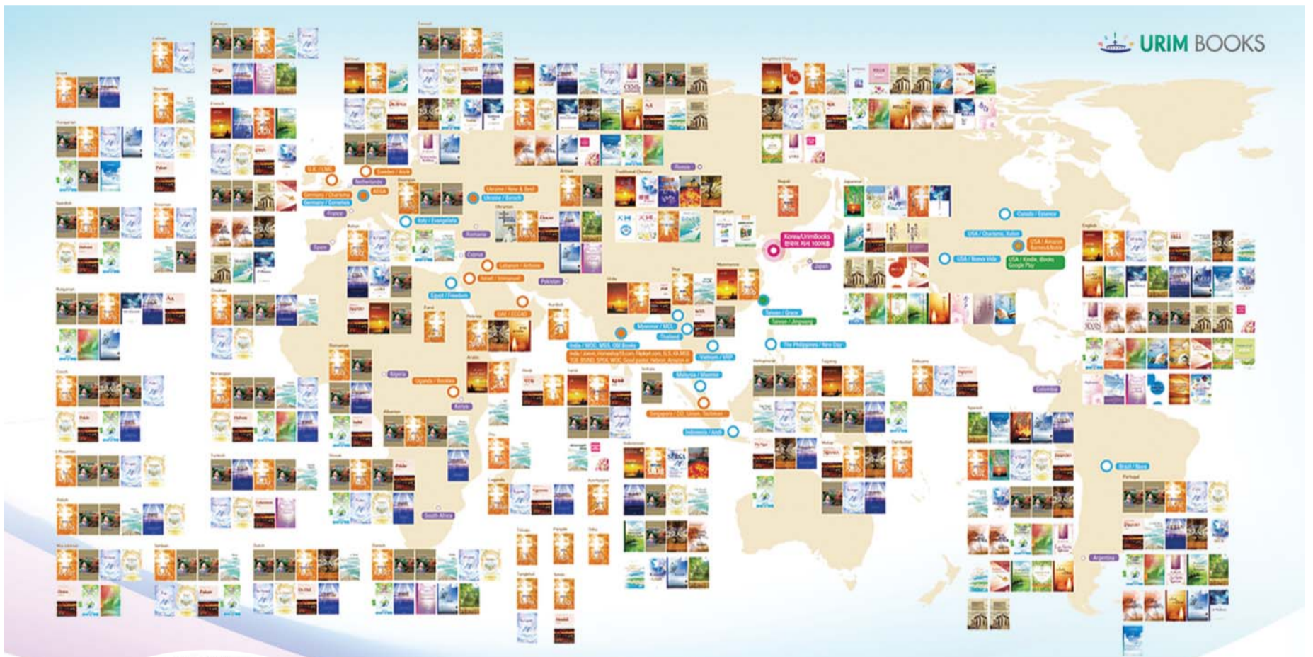
Hinulagway'ng Report sa Literary Media Ministry alang sa katawhan sa tibuok kalibotan