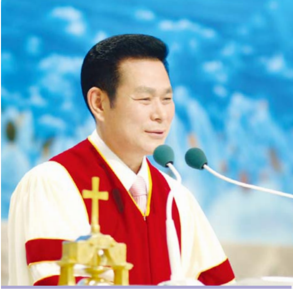
Старши пастор д-р Джейрок Лий

„И чрез никой друг няма спасение; защото няма под небето друго име дадено между човеците, чрез което трябва да се спасим“ (Деяния 4:12).