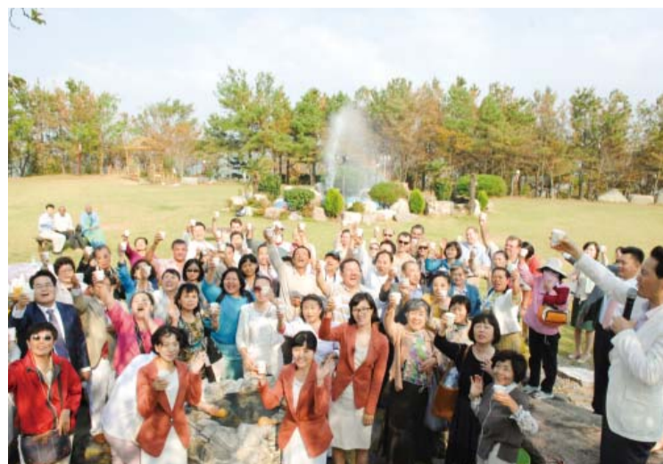
Посещение на обекта със сладка вода Муан, където се разкрила Божията сила (Муан, провинция Джионам)