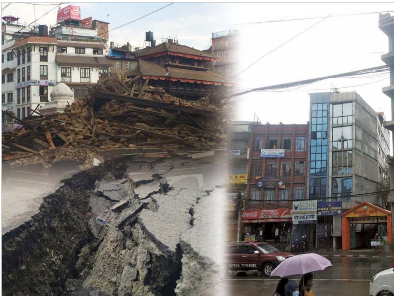
Голямото земетресение в Непал отне живота на хиляди хора. Нека се молим да няма повече щети и хората да не страдат от допълнителни травми. В допълнение, нека станем благословени Божии деца, които винаги са защитени от Него и Го възхваляват.

Изправени пред природни бедствия, хората са много малки и напълно уязвими същества. Въпреки това, Божите деца няма да загубят спокойствието, ако вярват в Бог, прилагат на практика Словото Му с любов към Него и вярват в Светлината. Така, както Бог защитил израилтяните в Гошен от Десетте чуми, идващи във всички области на Египет, Той позволява хората днес също да изпитат такива защитни дела на Неговата сила.