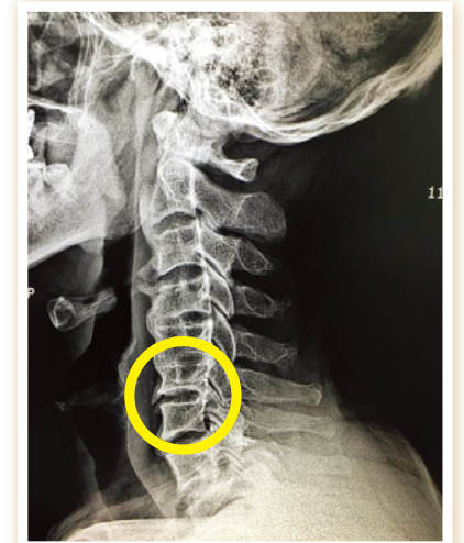
Цервикални прешлени 5 и 6 Той имаше променена поза на главата, но бе излекуван. Сега не изпитваше проблем да движи главата си.

Отдавам всички благодарности и слава на Бог, който отговори веднага на всичките ми проблеми.