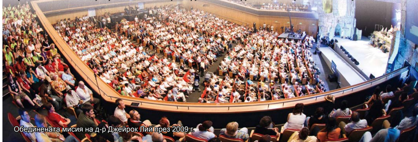
Обединената мисия на д-р Джейрок Лий през 2009 г.

Пристигнах в Сеул и получих молитвата на д-р Джейрок Лий. На 4 май, 2013 г., беше потвърдено, че бях напълно излекувана от среден отит с колестеатома. Невъзможно е заболяването да се излекува по естествен път и освен това, операцията може да причини странични ефекти и опасност от рецидив. Отдавам всички благодарности и слава на Бога.