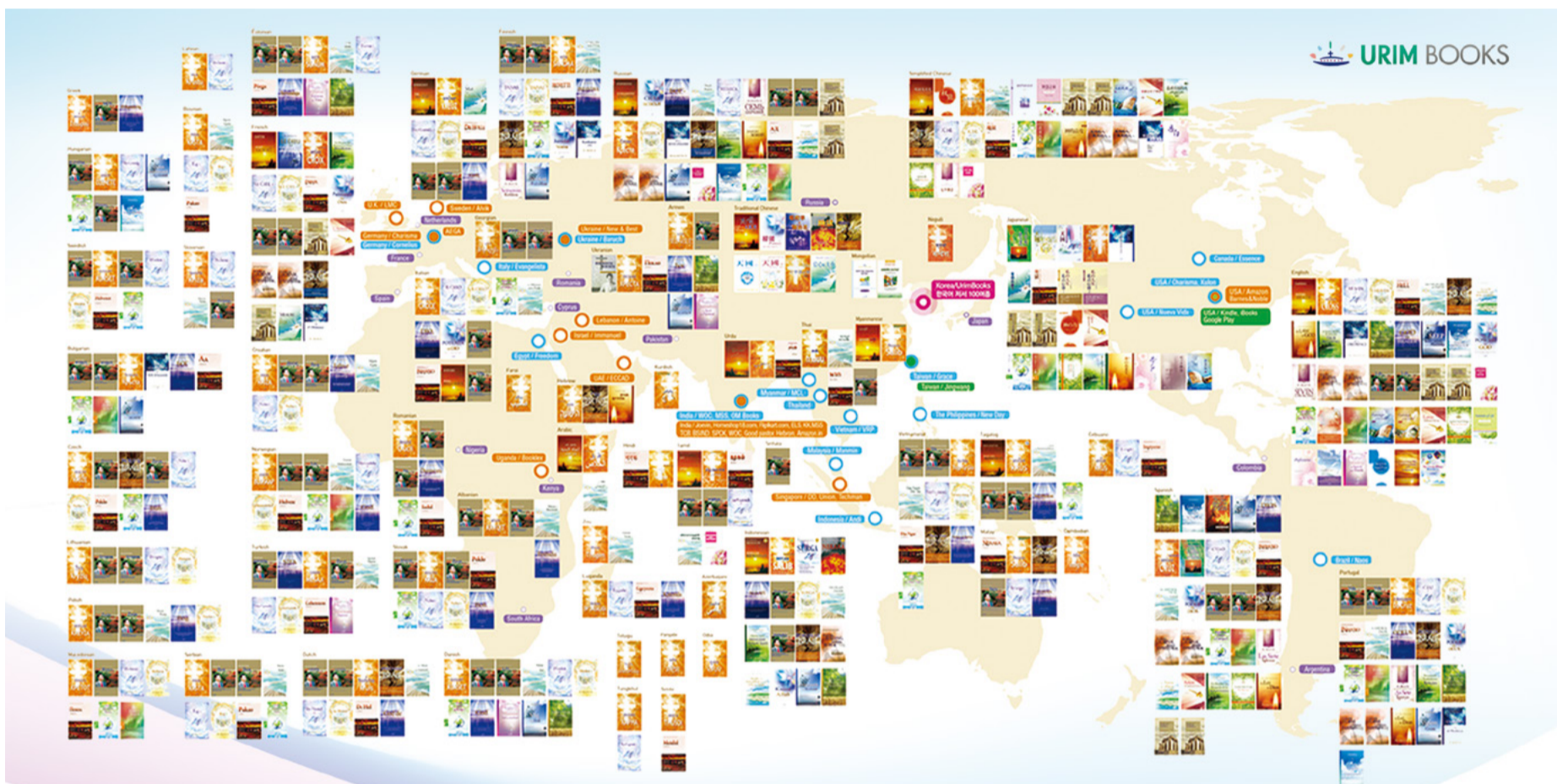
Foto verslag van de Literaire Media Bediening van mensen over de hele wereld