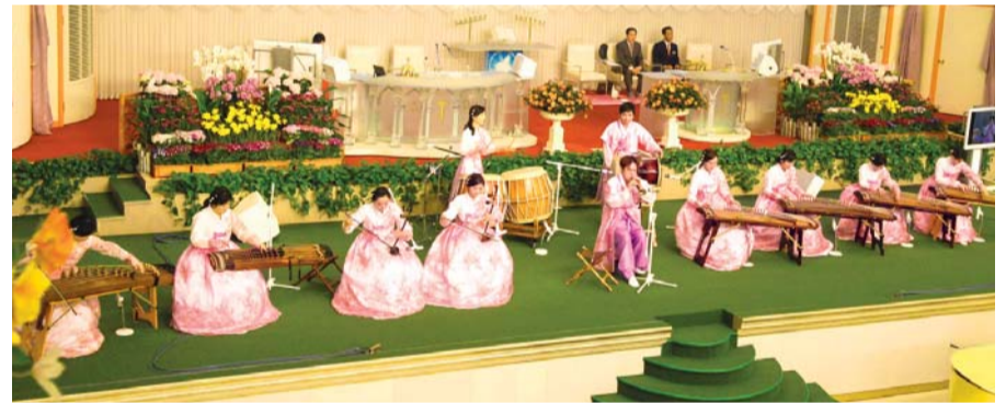
Seremi Korea Rahvamuusikagrupp esitab erinumbrit

Ma tänan Jumalat, kes andis mulle selle suure õnnistuse ja kes päästis mind – surma teel olijat – ja andis mulle Uue Jeruusalemma lootuse. Halleluuja!