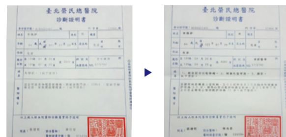
Enne palvet, dementsuse diagnoosiga (vasakul) Pärast palvet, kliinilise dementsuse 1. skaala sümptomid on kadunud (paremal)