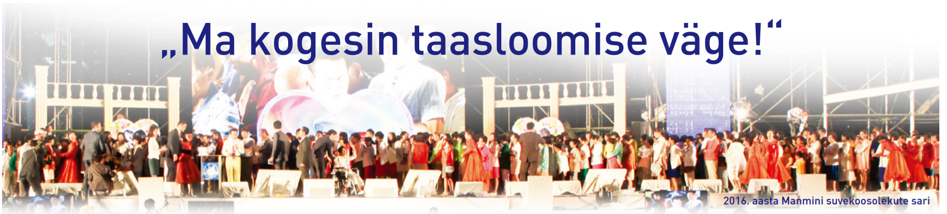
2016. aasta Manmini suvekoosolekute sari