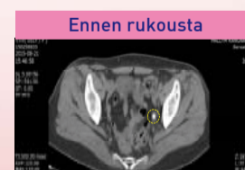
Ennen rukousta Virtsakivi, kooltaan 1,3 cm, vasemmassa virtsanjohtimessa

Olin kärsinyt 1,3 cm:n kokoinen virtsakiven aiheuttamasta kivusta. Minulle kerrottiin, että sen koon takia sitä olisi vaikea poistaa ilman leikkausta. Kuitenkin se katosi Jumalan voiman avulla. Annan kaiken kiitoksen ja kunnian elävälle Jumalalle, joka näytti tämän hämmästyttävän teon minulle.