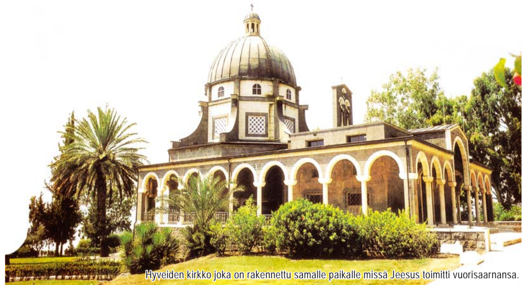
Hyveiden kirkko joka on rakennettu samalle paikalle missä Jeesus toimitti vuorisaarnansa.

Jeesus saarnasi kallisarvoista sanomaa väkijoukolle vuoren huipulta. Tätä saarnaa kutsutaan vuorisaarnaksi. Pian sumun tavoin katoaville ihmisille Jeesus opetti ikuisista siunauksista, eli taivaan kuningaskuntaan pääsemisen todellisesta siunauksesta. Tämä saarna käsittelee 'hyveitä.' Se on merkkipaalu jonka avulla me voimme tarkistella itseämme ja päästä Uuden Jerusalemin kaupunkiin missä Jumalan valtaistuini sijaitsee. Syventykäämme seuraavaksi tähän.