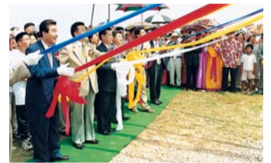
26. heinäkuuta 2000 Monumentin paljastusseremonia

Annan kaiken kiitoksen ja kunnian Jumalalle, joka siunasi Muanin Manmin-kirkkoa tulemaan Pyhän Hengen välineeksi pelastamaan lukemattomia sieluja Jumalan suuressa kaitselmuksessa lopun aikaa varten.