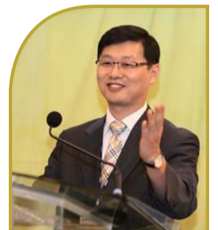
מצגת המקרה : ד"ר ג'ון סאנג קים. אוניברסיטת [מכללת] אולסן לרפואה בקוריאה

לקות ראייה כוללת: עיוורון רפואי ואובדן חמור בחדות הראייה כגון: 0.3 דרגות בעין עירומה. עקב זאת: רבים סובלים מקשיים ומכאבים חזקים ומנטליים. מחקר ה: ו.ב.ע. [WHO]- (וועד הבריאות העולמי) אשר ראה אור ב: 2012 אומר ש: 281 מיליון בני אדם סבלו מליקויים בראייה והסיבות העיקריות הינן: קוצר-ראייה, רוחק-ראייה, ליקוי במיקוד העדשה, או בעיות בכוח שבירת קרני האור[השתקפות].