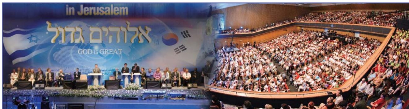
בספטמבר 2009 התקיים מסע ד"ר לי בישראל בכותרת: 'פסטיבל התרבויות הבינלאומי 2009'.