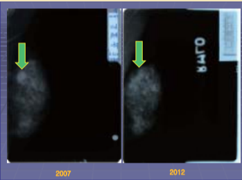
גוש בגודל: 2 ס"מ נעלם.