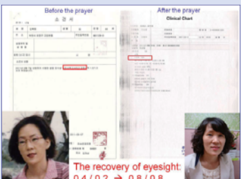
The recovery of eyesight: 0.4/0.2 → 0.8/0.8