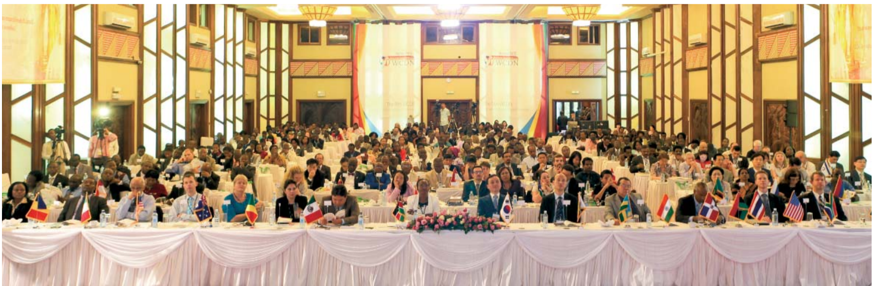
כנס הרופאים המשיחיים התשיעי של רמ"ב [WCDN] התקיים בקנייה שבאפריקה ונטלו בו חלק כ: 400 רופאים ומומחים מ: 37 מדינות. מצגות שמונה המקרים אשר הפגינו את פועל אלוהים החי והרצאות מיוחדות שונות גרמו לנוכחים לשבור את מסגרות עבודת הידע הרפואי שלהם ושתלו בם אמונה.