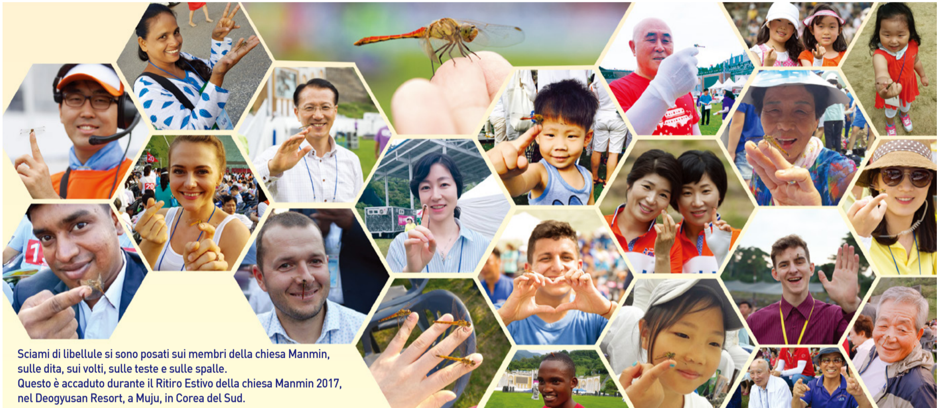
Sciame di libellule si sono posati sui membri della chiesa Manmin, sulle dita, sui volti, sulle teste e sulle spalle. Questo è accaduto durante il Ritiro Estivo della chiesa Manmin 2017, nel Deogyusan Resort, a Muju, in Corea del Sud.