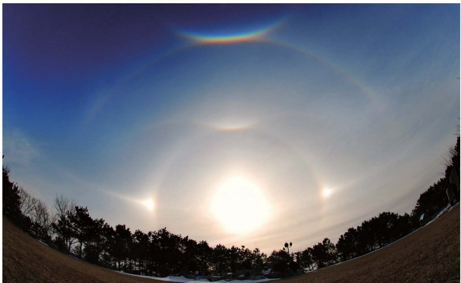
2011 оны Нэгдүгээр сарын 27-ны өдөр өглөөний 9:30-аас 10:30-ын хооронд (Чеолла-Нам-до Мүан гүн Хэеже мён Чонжанли сан №153 )д орших Мүан Амтат Усны хүрээлэнгийн дээр олон төрлийн гайхамшигт солонгуудын нийлбэр бий болсон билээ.

Бурханы хайр ба амлалтыг бидэнд мэдрүүлсэн үзэсгэлэнт солонго