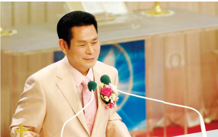
Доктор И Жэй руг

“Бид төлөвшсөн хүмүүсийн дунд мэргэн ухааныг ярьдаг. Ингэхдээ өнгөрөн одож буй энэ үеийн удирдагчдын ухааныг ч бус, харин нууц дотор буй Бурханы мэргэн ухааныг бид ярьдаг. Энэ нь бидний алдрын төлөө үеүдээс ч өмнө Бурханы урьдаас тогтоосон нуугдмал мэргэн ухаан мөн.” (1 Коринт 2:6-7).