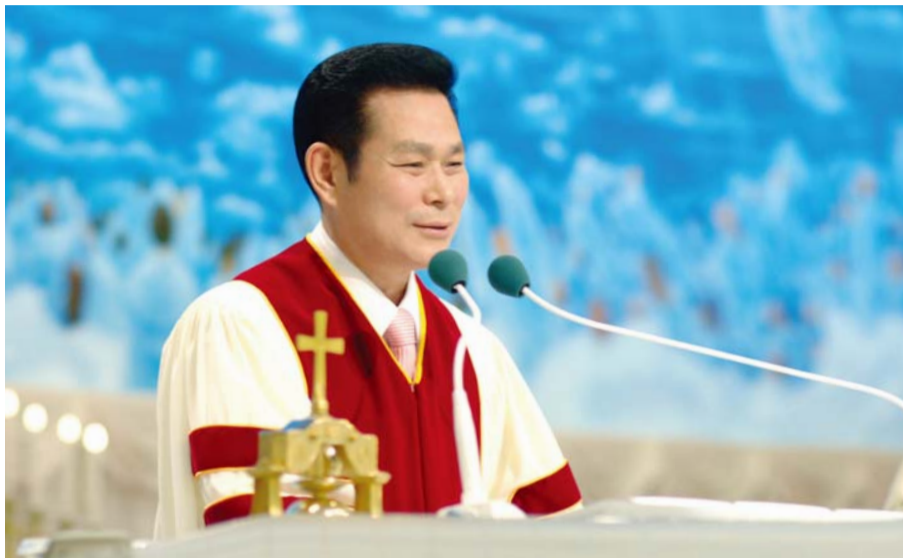
Доктор И Жей руг Тэргүүн Пастор

Хэрэв хэн нэгэн эр эм 2-н эр эм эсийг бүрэлдүүлд өөр нэгэн эмэгтэйн хэвлийд суулгахад тэр эмэгтэй хүүхэд төрүүлэхэд тэр хүүхдийг өөрийнхөө хүүхэд гэнэ гэж үү? Эсвэл инкубаторт өссөн хүүхэд инкубаторыг «эж» гэж дуудахгүй биз дээ?