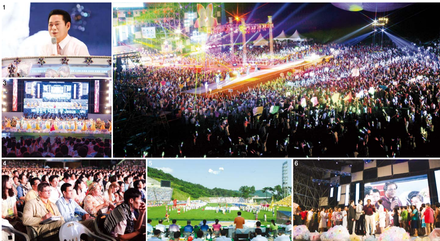
И Жейруг Тэргүүн пастор хамт оролцсон 2013 оны Манмины Зуны цуглаан цаг агаарын хамгийн таатай нөхцөлд бүх үйл ажиллагаа явагдаж байгаа нь (Зураг 1). Сургаалын үеэр (Зураг 4, 6), Уралдаант тэмцээний өдөр (Зураг 5), Галын Наадамын Магтаал Хүндэтгэл (Зураг 2, 3).

22 орноос ирж оролцсон Манмины Зуны Цуглааныг GCN TV-р шууд дамжуулав