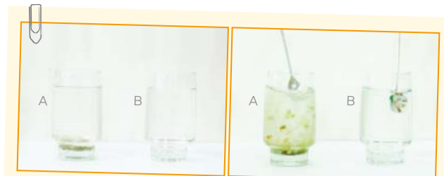
А, Б хоёр шилэн аяганд байгаа усыг хальт харахад хоёулаа цэвэрхэн харагдаж байгаа боловч А шилэн аяганы ёроолд нь элс, шороо байгаа ба Б шилэн аяган дахь нь цэвэр ус юм (Зүүн талын зургийг харна уу). Халбагаар хоёр шилэн аягатай усыг хутгахад А шилэн аягатай усыг ёроолд нь байгаа зүйл нь дээш хөөрөн бохирдуулахад, харин Б шилэн аягатай ус цэвэрхэн хэвээрээ байна. (Баруун талын зургийг харна уу). Үүн шиг бид зүрх сэтгэлдээ байгаа бүх хорон муугийн хэлбэрээ хаясны дараа л ямар ч нөхцөл байдалд цэвэрхэн, тунгалаг, сайхан байж чадна гэдгийг харуулж байна.

Бидний Тэнгэрлэг Бурхан Аав маань хайртай хүүхдүүд нь төгс, ариун байгаасай хэмээн хүсдэг. Тэгвэл ухаалаг итгэгчид яах ёстой вэ? Бид Бурханы үгэн дээр суурилан өөрсдийгөө таньж мэдэн, гэм нүглийг цус урсгах мэт тэмцэж, хорон муугийн бүхий л хэлбэрийг хаях ёстой юм. Доор дурьдсан зүйлсээр өөрийгөө хэрхэн таньж мэдэн, хаясан болохыг шалгацгаая.