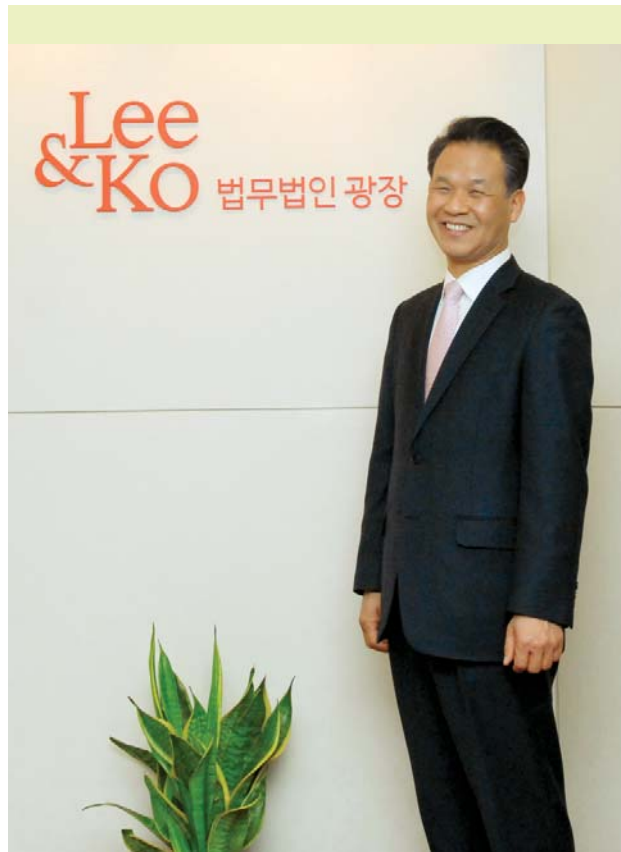
Пак Хун ги ахлагч (1-4 хэсэг, Хуулийн хэсэг)

Би хэсэг бүлэг, багуудын Удирдагчдын Холбоо, Санхүүгийн албаны гишүүдийг удирдагчдынх нь