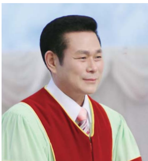
И Жей руг Тэргүүн пастор

“Хайр хэзээ ч дуусдаггүй. Харин эш үзүүлж байгаа бол, тэдгээр нь үгүй болно. Хэрэв олон янзын хэлүүд байгаа бол тэд болих болно. Хэрэв мэдлэг байгаа бол энэ ч үгүй болно... Харин эдүгээ итгэл, найдвар, хайр гурав үлддэг боловч хамгийн агуу нь хайр мөн” (1 Коринт 13:8-13).