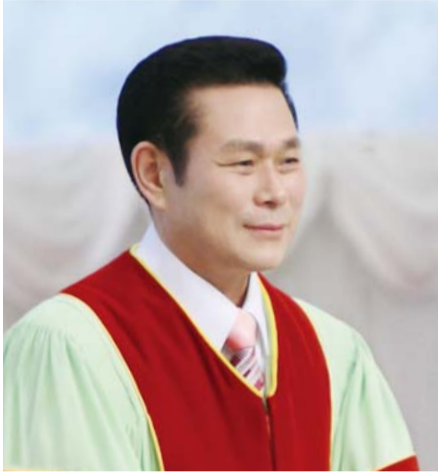
И Жей руг Тэргүүн пастор

“Харин дээрээс ирэгч мэргэн ухаан нь нэгд ариун, тэгээд амар тайван, эелдэг, ул суурьтай, өршөөл ба сайн үр жимсээр дүүрэн, ялгаварладаггүй, хоёр нүүр гаргадаггүй аж” (Иаков 3:17).