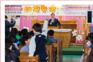
Эцсийн үед, Сүнс талаар сэрүүн баймаар байвал~ Бялхам бялхам залбирал хийх

Маимин төв сүмийн Хүүхдийн баг нь хаврын амралтыг тохиолдуулан өнгөрсөн 2-р сарын 22ноос 24нийг хүртэл ‘Тусгай сургалт’-г зохион явуулж, Манминий балчир хүүхдүүд Эзэн дотор өөрсдийн мөрөөдөл ба зорилготой болох талаар ивээл дүүрэн цаг болж өнгөрлөө.