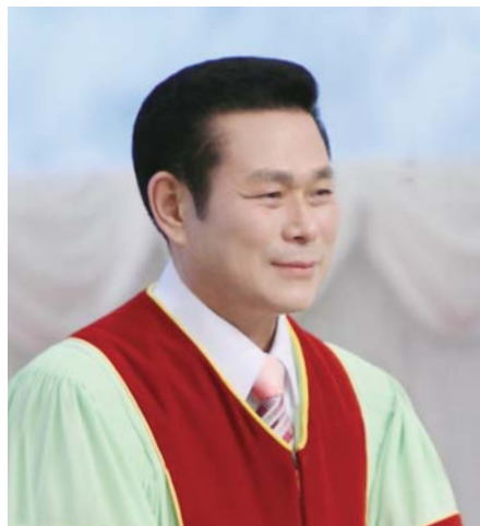
И Жей руг пастор

“Итгэлээр, Иосеф нас барж байхдаа Израйлийн хөвгүүд дүрвэх тухай дурдаж, өөрийнх нь ясыг хаана тавихыг гэрээсэлсэн билээ” (Еврей 11:22).