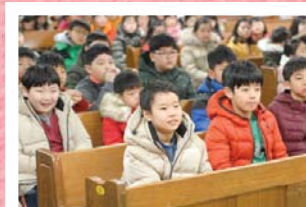
Миний мөрөөдөл хүсэл, тэмүүлэл ‘Леви ажилтан (Сүмийн ажилтан)’ юу хийдэг вэ?