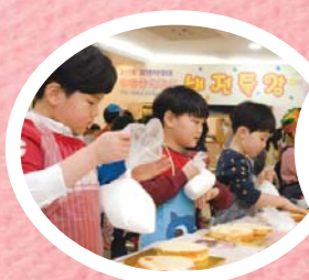
Миний гарын хоол ‘Өхөөрдөм бялуу’