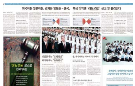
Өдөр Тутмын Жон-Ане Сатуул, МБС (Мавел Бизнес Сүлжээ), Энхэл Мэдээгүүд, СБС (Сөүл Хэвлэл Мэдээллийн Систем)