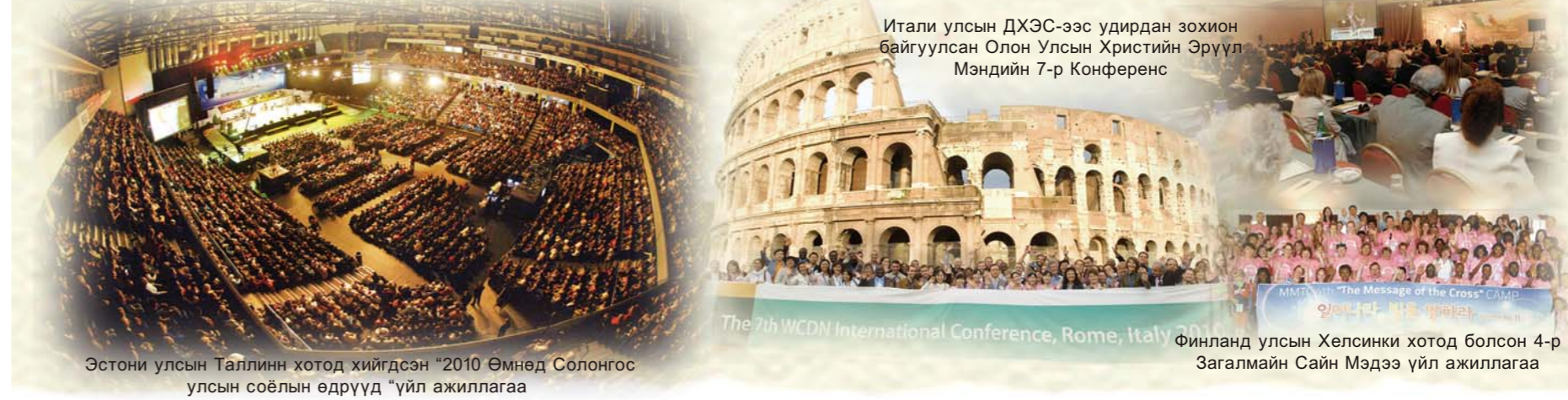
Эстони улсын Таглин хотод хийгдсэн "2010 Өмнөд Солонгос улсын соёлын өдрүүд" үйл ажиллагаа

Эстони улсад болсон тэрхүү гайхамшигт нэгдсэн цуглааны үйл ажиллагаанд салот мэт Ариун Сүнсний гайхамшигууд бий болон Бурханы гайхамшигт энэрэл ивээл эдгэрлийг маш олон хүмүүс хүлээн авчгаасан билээ. Энэхүү нэгдсэн цуглаанаар дамжуулан сүнсний үхмэл байдалд байсан Европын маш олон Христийн сүмүүдийг идэвхжүүлэн Ариун Сүнсний гал дөлийг бадраав.