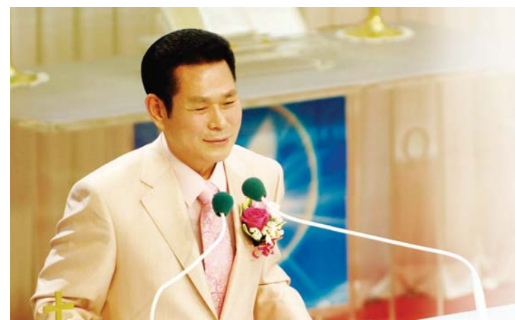
Доктор И Жэй руг

"Бид төлөвшсөн хүмүүсийн дунд мэргэн ухааныг ярьдаг. Ингэхдээ энэ үеийн мэргэн ухааныг бус, өнгөрөн одож буй энэ үеийн удирдагчдын мэргэн ухааныг ч бус, харин нууц дотор буй Бурханы мэргэн ухааныг бид ярьдаг. Энэ нь бидний алдрын төлөө үеүдээс ч өмнө Бурханы урьдаас тогтоосон нуугдмал мэргэн ухаан мөн." (1 Коринт 2:6-7).