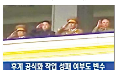
Хойд Солонгосын удирдагчийн хүү нь дараагийн удирдагч болох нь