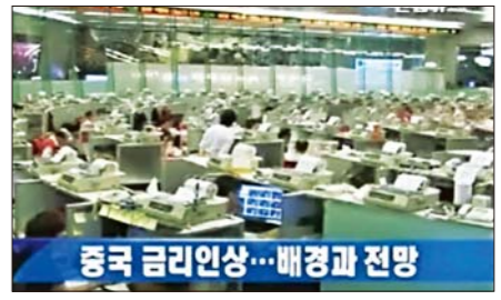
Хятадын мөнгөний хүүгийн өсөлт нь ямар учиртай вэ?