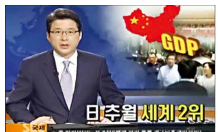
Хятад улс нь Япон улсыг гүйцэн дэлхийд эдийн засгийн хоёр дахь том гүрэн болов