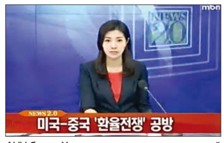
АНУ болон Хятад улсын хоорондох мөнгөний ханшнаас үүсэлтэй дайн