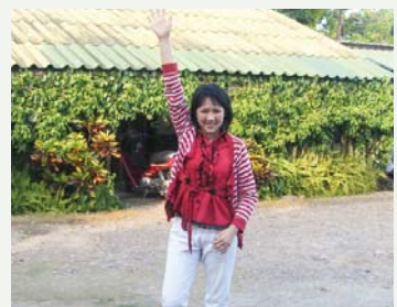
မြန်မာအမျိုးသမီးငယ် ရစ်ချနာပွန်ဆတ်သည် လက်ကိုင်ပုဝါတင်၍ ဆုတောင်းခြင်းဖြင့် ပြန်၍ အသက်ရှင်နိုင်ခဲ့ကြောင်း တွေ့ရသည်။