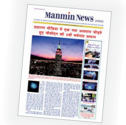
जोशा सोतन मानमिन समाचारको हिन्दी संस्करण बाँदै

परमेश्वरको यस्तो उदैकको कार्य देखेर उनको परिवारको सदस्यहरू र त्यो क्षेत्रका मानिसहरू हिन्दुबाट ख्रीष्टियनमा परिवर्तन भए । शुरुमा वे न्वल २० परिवारहरू विश्वासमा आए तर भन्नु यो कुरा बरपरका क्षेत्रहरूमा फैलिँदै गएपछि करिब एक सय परिवार ख्रीष्टियन वन्न पुगे । उहाँको बुबा त्यस क्षेत्रको प्रभावशाली व्यक्तित्व भएको कारण अन्य आफन्तहरू आसपासमा धेरै जनासँगै भएकोले यो सम्भव हुन सक्यो ।