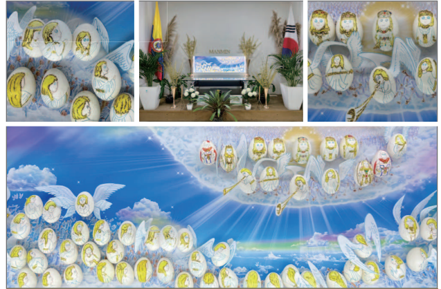
NO EXTERIOR / GRANDE PRÊMIO