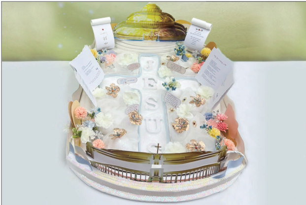
NACIONAL / GRANDE PRÊMIO