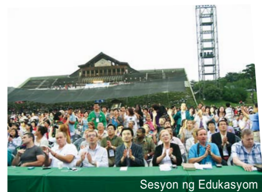
Sesyon ng Edukasyon