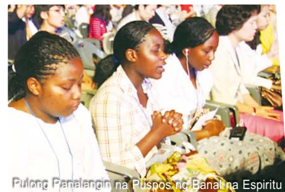
Pulong Panalangin na Puso ng Banal na Espiritu