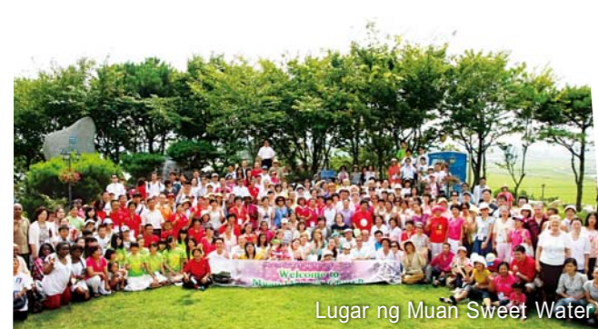
Lugar ng Muan Sweet Water