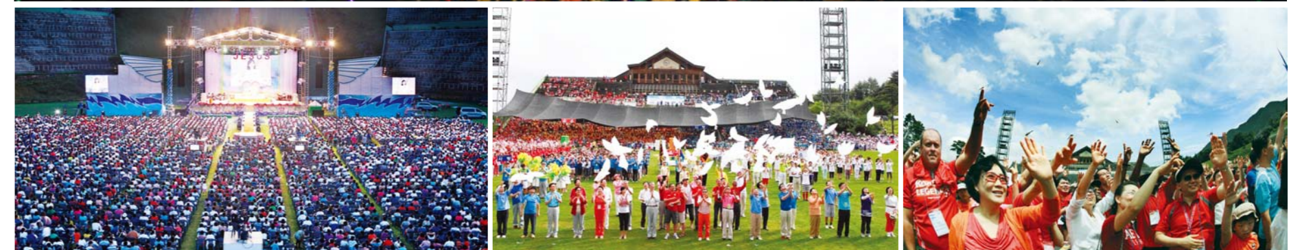
Ang Retreat sa Tag-init ng Misyong ng Kalalakhian at Kababaihan ng Manmin para sa 2011 ay ginanap sa pangunahing tema na ‘Pagtitiwala’ mula Agosto 1 - 3. Dumalo at nakibahagi ang mga mananampalataya at at mga pastor mula sa Korea at ibang bansa. Ito ay katulad ng isang pagdiriwang na puno ng pag-ibig at pagpapala.

Ang Retreat sa Tag-init ng Manmin ay isang mahalagang pagkakataon para sa mga miyembro na ‘muling palakasin’ ang kanilang espiritu at katagpuin ang buhay na Diyos sa pag-ibig ng Panginoon habang bakasyon sa tag-init.