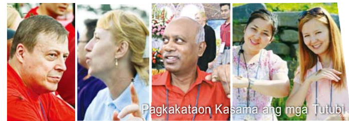
Pagkakataon Kasama ang mga Tutubi