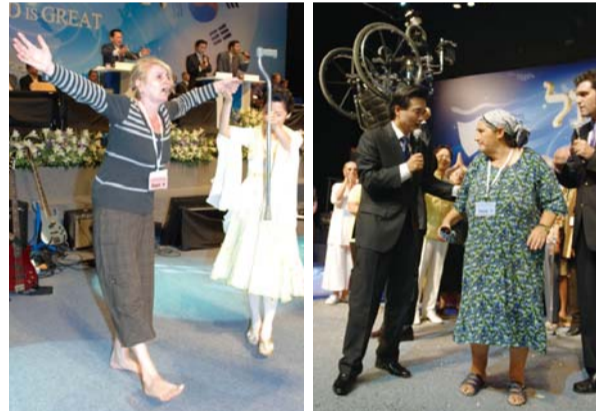
การจัดประกาศในอิสราเอลปี 2009 ของ ดร. แจร์จ ลี มีขึ้นที่ศูนย์การประชุมนานาชาติในกรุงเยรูซาเล็มซึ่งเป็นศูนย์กลางของอิสราเอล ท่านเทศนาพระคำและสำแดงการทำงานด้วยฤทธิ์อำนาจโดยคำอธิษฐานต่อผู้ป่วยซึ่งถวายเกียรติแด่พระเจ้า การประกาศครั้งนั้นถูกถ่ายทอดออกไปยังประเทศต่าง ๆ มากกว่า 220 ประเทศผ่านสถานีโทรทัศน์สาธารณะ เคเบิลทีวี และโทรทัศน์ดาวเทียมซึ่งเป็นเหตุให้ผู้คนจำนวนมากไม่ถ่วงได้รับความรอด คำตอบ และการรักษาโรค