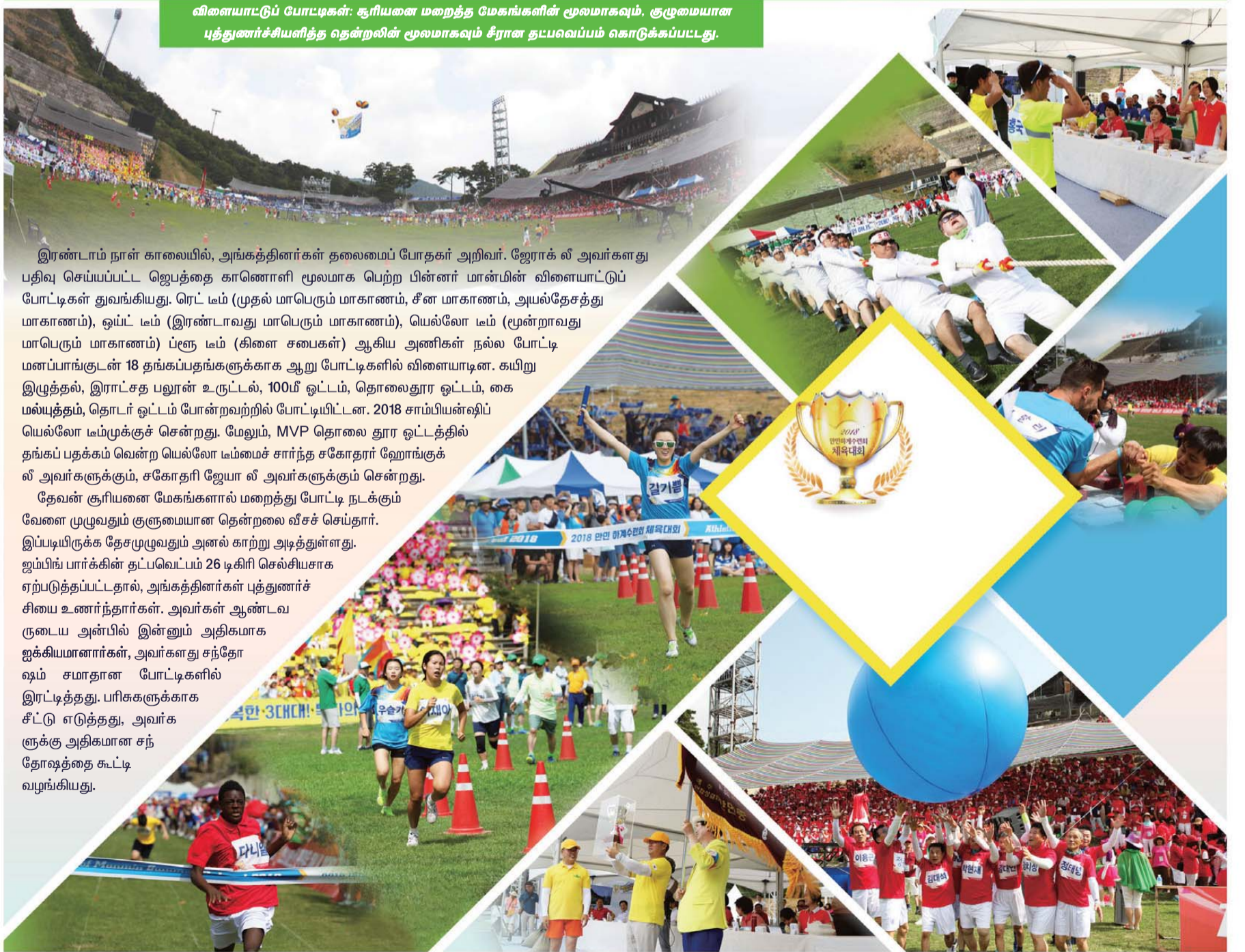
விளையாட்டுப் போட்டிகள்: சூரியனை மறைத்த மேகங்களின் மூலமாகவும், குருமையான புத்துணர்ச்சியளித்த தென்றலின் மூலமாகவும் சீரான தட்பவெப்பம் கொடுக்கப்பட்டது.

கிறிஸ்துவில் பிரியமான சகோதர சகோதரிகளே, மனித ஞானத்தை கடந்துச் செல்கிற தேவ ஞானம் உலக ஞானத்தைவிட வித்தியாசமானது. ஞானம் நற்குணத்தின் அடிப்படையில் உள்ளது. ஆக நீங்கள் ஞானத்தை உணர்வதற்கும் நீங்கள் உணர்ந்தவற்றை பயிற்சி செய்வதற்கும் நீங்கள் பரிசுத்தமாக வேண்டும். ஞானத்தின் ஆரம்பமாய் இருக்கிற தேவனிடத்தில் உங்களுக்கு சுத்தமான ஞானத்தை கொடுக்கும்படியாய் கேட்டு பெற்றுக்கொள்ள உங்களை ஊக்கப்படுத்துகிறேன். இப்படிச் செய்வதால் நீங்கள் எல்லாவற்றிலும் செழித்து அபரிதமான களியுடன் தேவனை மகிமைப்படுத்தும்படியாய் ஆண்டவருடைய நாமத்தில் ஜெபிக்கிறேன்.