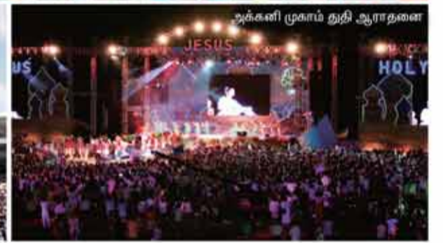
அக்கினி முகாம் துதி ஆராதனை

மான்மின் ஆண்கள் மற்றும் பெண்கள் பணித்தளத்தின் கோடை ஏகாந்தம் ஜியான்புக் மாகாணம் மூலீவில் உள்ள டியோகியுன்சன் கோடை வாசஸ்தலத்தில் நடைபெற்றது. ஆகஸ்டு 6 முதல் தொடர்ந்து இரு இரவுகள் மற்றும் மூன்று பகல்கள் திருச்சபை அங்கத்தினர்கள் ஆவியாயிருக்கிற தேவனின் இருதயத்தைக் கற்றுக்கொண்டு பல்வேறு நிகழ்ச்சிகளின் மூலமாக தங்கள் விசுவாசத்தை அதிகரித்துக் கொண்டனர்.