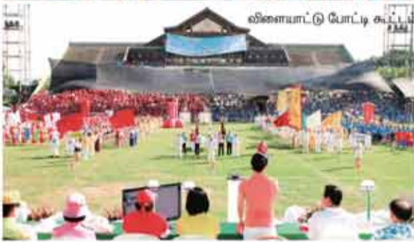
விளையாட்டு போட்டி கூட்டம்