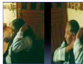
◀ 接受禱告後：肩膀活動好轉，可以梳頭了。