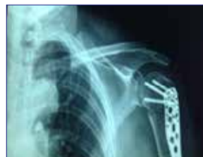
◀ 接受禱告前：因肱骨外髁頸粉碎性骨折，接受鋼板固定術。