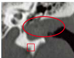
◀ 接受禱告前：外耳道灌滿膽脂瘤（畫圓圈部位），腐蝕外耳道下邊骨頭（畫箭頭部位），將鼓膜和聽小骨推向內側。