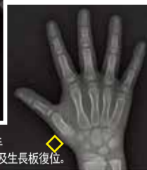
接受禱告後：右手大拇指底部骨折及生長板復位。