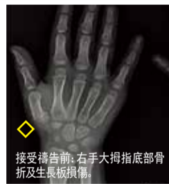
接受禱告前：右手大拇指底部骨折及生長板損傷。

後，兒子聖潔好像從沒受過傷似的，大拇指能夠隨意自如地活動。藉此，我們全家人都體會到父神無微不至的愛，信心越發增長。將所有的感謝和榮耀都歸於三一真神！