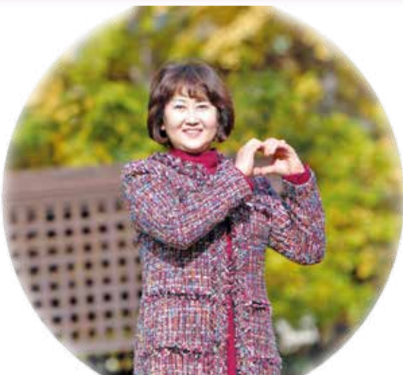
張德芬勸事（62歲，2大大17教區）

第二天，教區長來探訪，用主任牧師禱告過的權能手帕（使徒行傳19章11、12節）為我禱告後，儘管刀絞般的胸痛消失了，但呼吸仍然急促，若不戴氧氣罩，胸悶得還是難以忍受。身上力氣似乎耗盡，連動動指頭的勁兒也沒有。我一直堅持在神面前做悔改禱告，抱著面見主任牧師的期盼支撐下來。