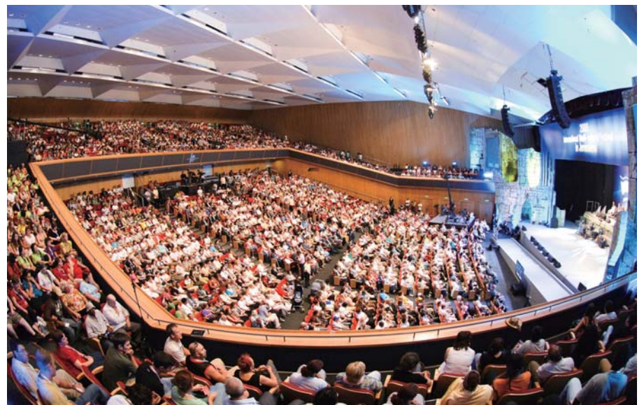
Об'єднана кампанія доктора Джерок Лі в Ізраїлі, 2009 рік

На даний момент люди, які живуть в Ізраїлі, можуть дивитися програми з проповідями доктора Лі і отримувати його молитви за хворих через канал ТіБіЕн Росія, СіЕнЕл ТіВі, Холі Год ТіВі а також Родной ізраїльського телебачення.