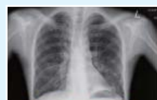
Sau khi cầu nguyện Anh đã có những chỗ tối trong phổi do vi khuẩn lao phổi trước đây, nhưng hiện nay không còn thấy chúng nữa.