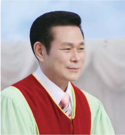
Mục sư Tiến sĩ Jaerock Lee

“Người chó giết người” (Xuất Ê-díp-tô ký 20:13)