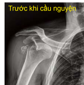
Trước khi cầu nguyện Do chấn thương bên ngoài, các khớp vai phải đã bị trật khớp và lồi củ lớn hơn của xương cánh tay bị chia thành từng miếng nhỏ.

Hơn nữa, các bộ phận xương bị vỡ vụn đã được nối lại với nhau vào đúng vị trí của chúng không cần phẫu thuật. Vào ngày 3 tháng 7, tôi nhận được lời cầu nguyện của Mục sư trưởng khi ông trở lại nhà thờ từ nhà nguyện trên núi. Tôi cảm thấy mát mẻ và thoải mái trong lời cầu nguyện. Vào buổi tối, tôi cởi hỗ trợ bảo vệ và cảm thấy bình thường. Hallelujah!