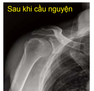
Sau khi cầu nguyện Các bộ phận bị gãy của lồi củ lớn hơn của xương cánh tay đã được nối lại vào đúng vị trí của chúng như thể chúng đã được nối lại thông qua các cuộc phẫu thuật và xương bị trật khớp cũng được ở đúng chỗ của nó.