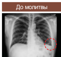
▲ Аномальная реберно-диафрагмальная картина плевральной полости, ребер и диафрагмы

17 февраля я вновь прошел обследование. Доктор сказал: «Нет ни пневмонии, ни плеврита. Нет даже следа плеврита». Он сказал, что я здоров. Аллилуйя!