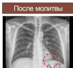
▲ Нормальный реберно-диафрагмальный угол