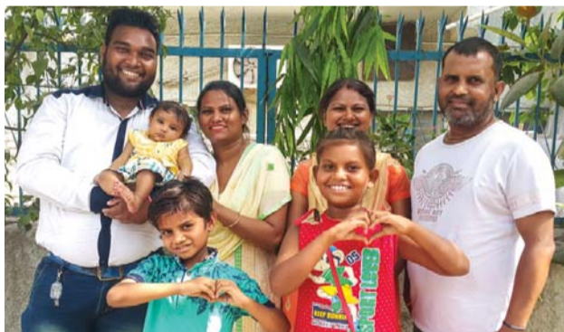
Семья сестры Кавиты (слева), где она с сестрой, деверем, племянниками и племянницами

Но и это еще не все. Мой муж получил на работе деньги, которые он даже не ожидал получить. И мы смогли выплатить все свои долги. Я воздаю всю благодарность и славу Богу, благодаря Которому отчаяние сменилось надеждой. Я также благодарна старшему пастору, который молился за меня.