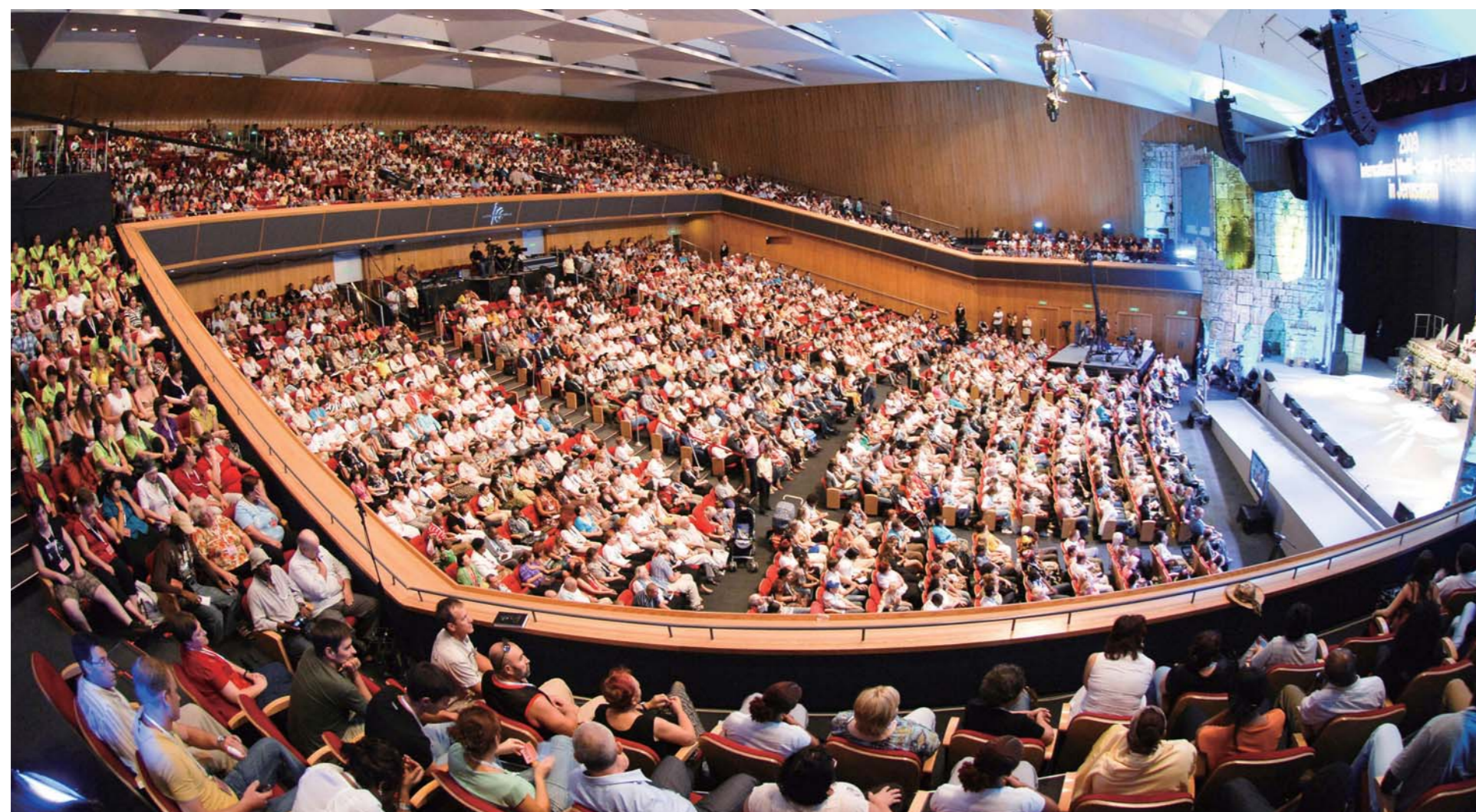
Все внимание гостей из 36-ти стран мира было сосредоточено на проповеди д-ра Джей Рока Ли, которую он произнес на Межкультурном фестивале-2009, в Международном центре конвенций, в самом сердце Израиля - Иерусалиме.