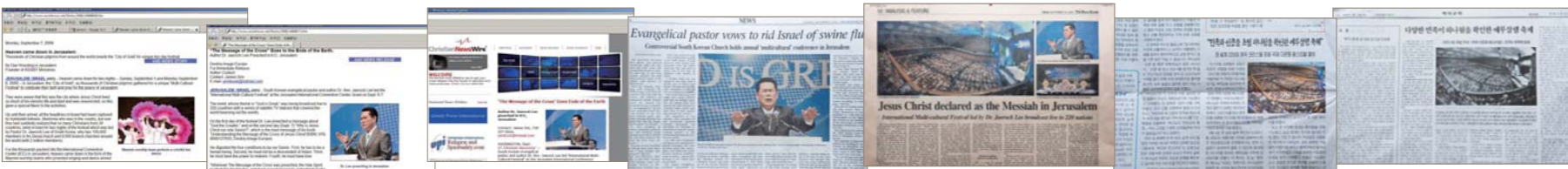
Ведущие информационные агентства, включая Рейтер и Франс Пресс, рассказывают о Международном межкультурном фестивале -2009