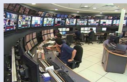
33 телестанции и телеканала вещали на 220 стран мира через RRSat, глобальную коммуникационную сеть