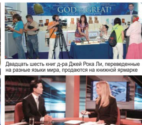
Двадцать шесть книг д-ра Джей Рока Ли, переведенные на разные языки мира, продаются на книжной ярмарке