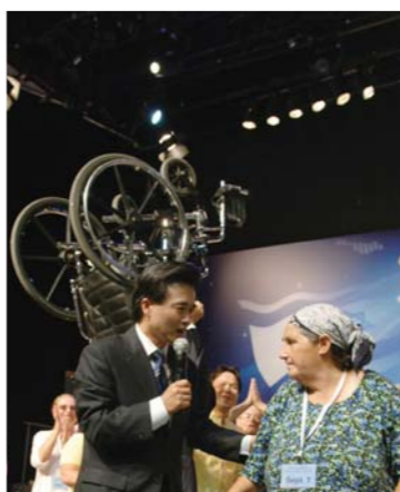
Первый раз за 19 лет человек смог поклониться коленями – по молитве старшего пастора