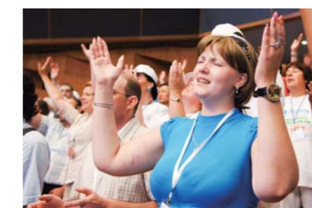
Зрители прославляют Бога