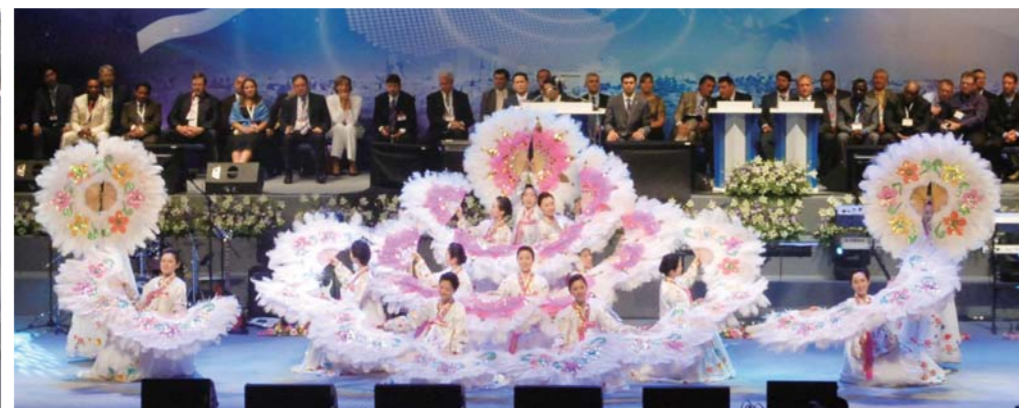
Танец с веерами сопровождает песню «Золотой Иерусалим»