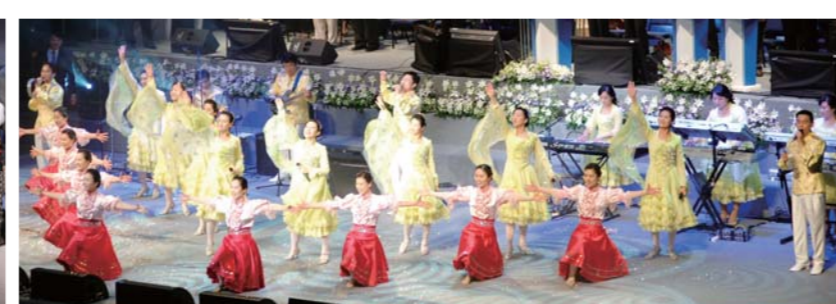
Группа прославления славит Бога на пяти языках: английском, французском, русском, иврите и лингала