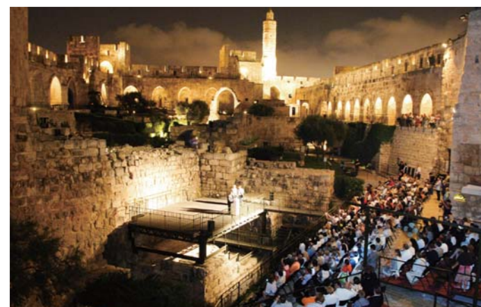
«Родной Израиль» – церемония открытия канала сети РВН, первой христианской телестанции в Израиле, почетным председателем которой был назван д-р Джей Рок Ли