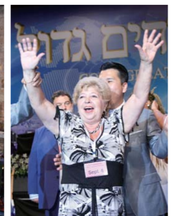
Женщина глубоко тронута исцелением от боли в спине