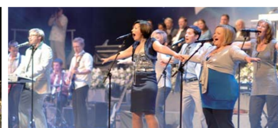
Группа прославления из Израиля