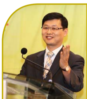
Случай, представленный д-ром Джун Сун Кимом, медицинский колледж университета Ульсан (Корея)