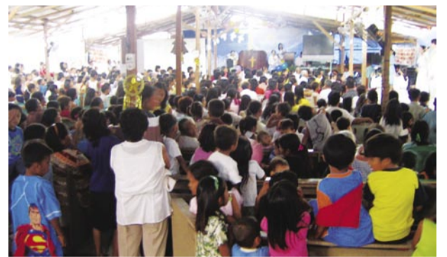
El Servicio del Sexto Aniversario en la Iglesia Cavite Manmin en las Filipinas, y Cruzada del Pañuelo en Manila y las Iglesias Cavite Manmin (Diciembre 22~24, 2006) (Fotografía de “La Cruzada del Pañuelo en la Iglesia Cavite Manmin”)