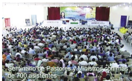
Seminario de Pastores y Ministros con más de 700 asistentes