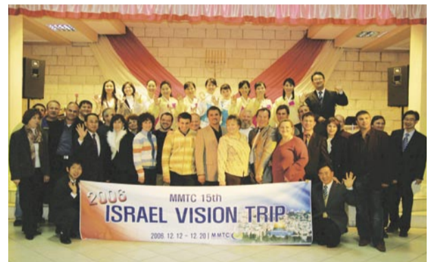
Centro de Entrenamiento Misionero de Manmin (MMTC) en Israel, en su 15th viaje de la visión (Diciembre 12~20, 2006)