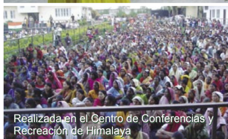
Realizada en el Centro de Conferencias y Recreación de Himalaya

Martes 14 de Noviembre - Seminario de Pastores y Ministros y Cruzada del Pañuelo / Innumerables casos de sanidad y conversión