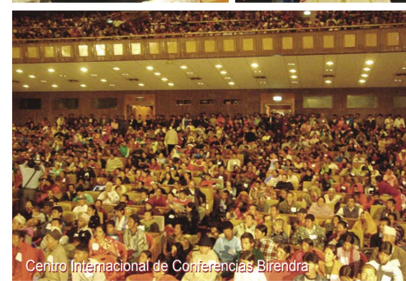
Centro Internacional de Conferencias Birendra

Domingo 19 de Noviembre - Oración del Pañuelo / Tremendas obras de sanidad del Espíritu Santo