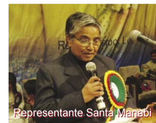
Representante Santa Manabi