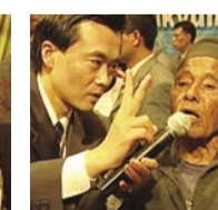
Nathadara (Nepal; 82) restauración de su vista