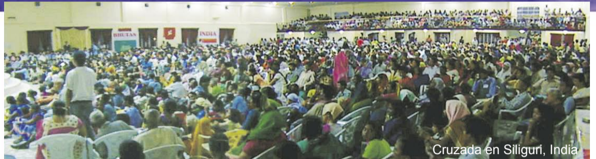
Cruzada en Siliguri, India