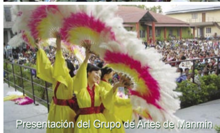
Presentación del Grupo de Artes de Manmin