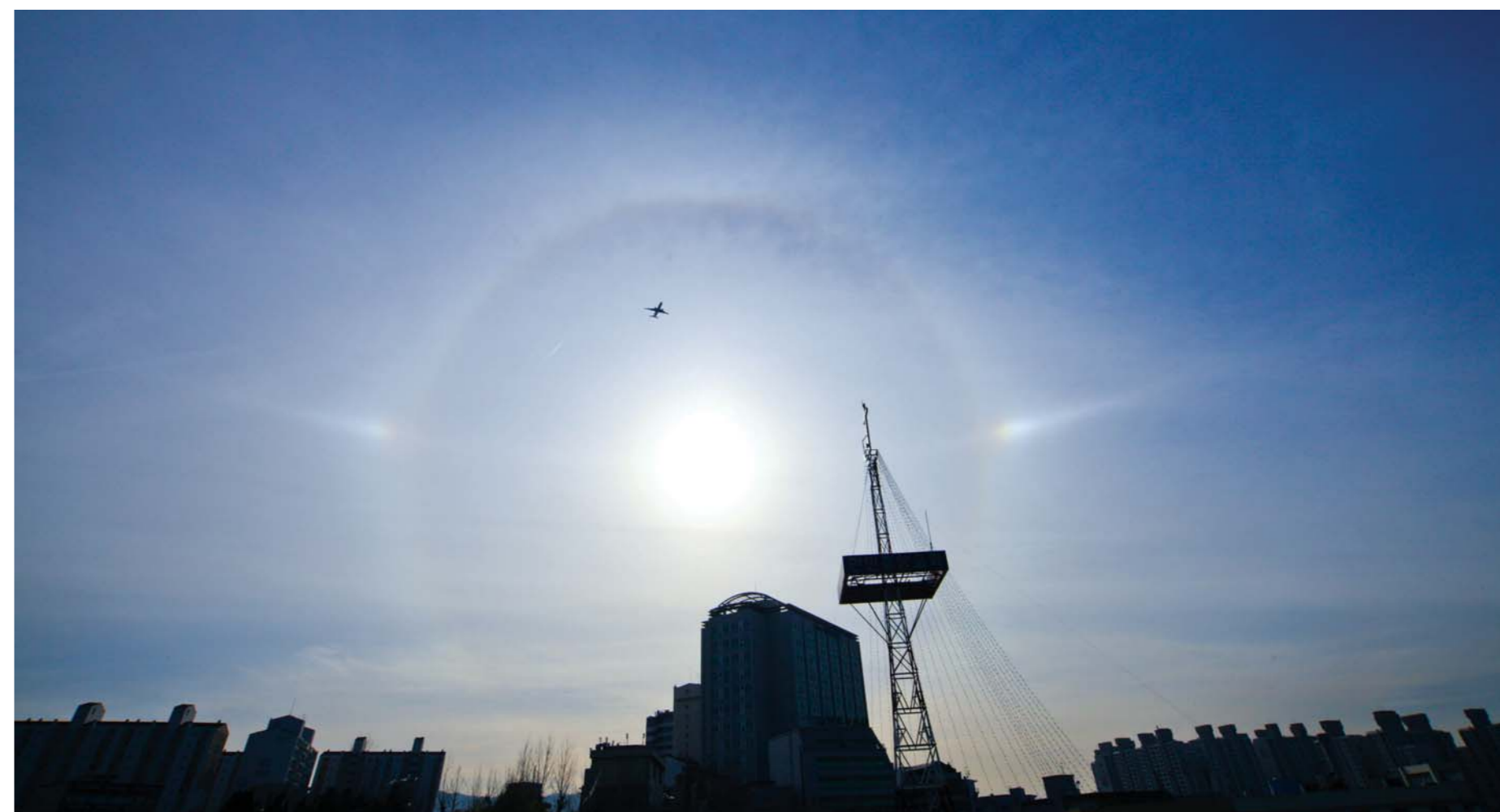
El 7 de diciembre a las 9:00 hrs. un arcoiris circular se formó alrededor del sol, el mismo que poco a poco se convirtió en un arcoiris extraordinario hasta las 11:30 hrs. En la tarde del mismo día, otro arcoiris apareció sobre el primero de manera simétrica.