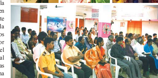
Muchos miembros de la Iglesia Manmin de Chennai recibieron sanidad por medio de la oración con el pañuelo por parte de la Presidenta Boknim Lee. También se alegraron al recibir el “arroz del amor” de su parte (Equipo de Alabanza de Poder en el centro).